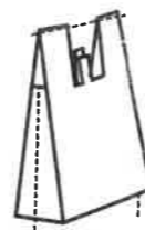
① 大きめのレジ袋を用意します。持ち手と両脇を切って開きます。