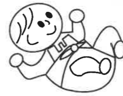
④ 下側の持ち手部分をT字体の要領でお尻からお腹の前に入れておきます。