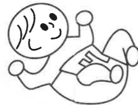
⑤ 余った部分を下に折り返してできあがり!